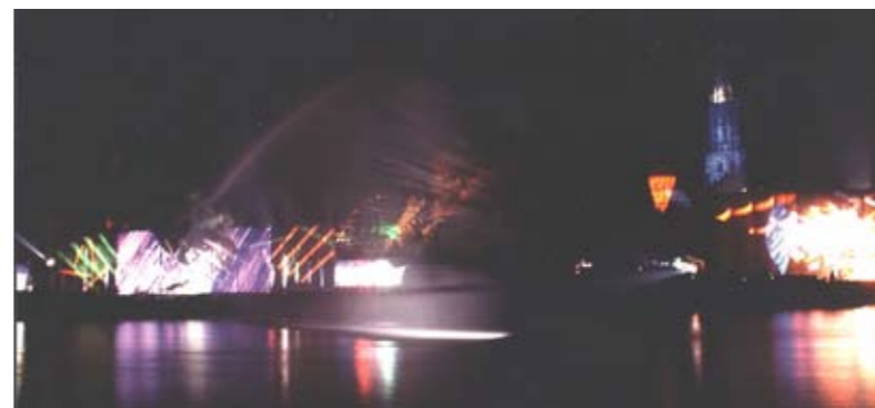
L'homme qui vole-spectacle inaugural/Ulm "Cinq chants allemands"

GRAME CENTRE NATIONAL DE CREATION MUSICALE 9 rue du Gare - BP 1185 69202 LYON cedex 01 Tél. 04 72 07 37 00 - Fax .04 72 07 37 01 Web. http://www.grame.fr