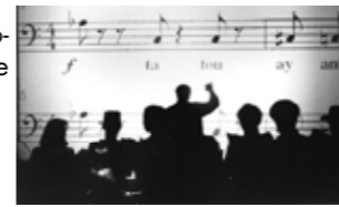
Les animaux de personne .....©C.Ganet

Création au Centre Théo Argence le 18 Mars 2006/Biennale Musiques en Scène